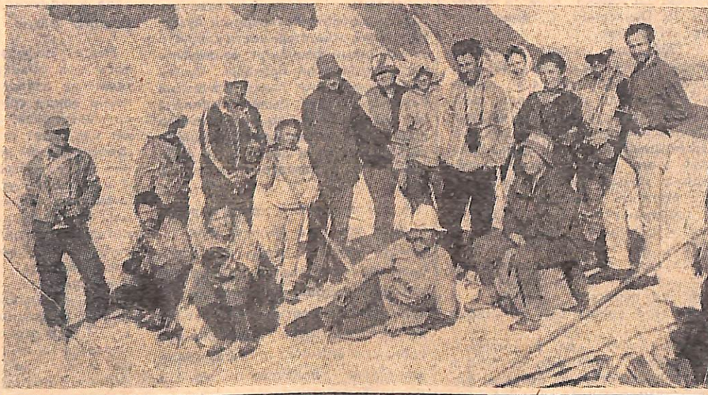
Редактор ДУБИНКИНА С. А.